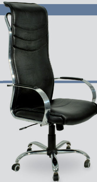
Art. 610 - cromo Art. 1310 - negro

Sillas en novaino (negro, rojo, azul, blanco) o multilaminado postformado (negro, blanco) con bases de hierro redondo (cromo, negro), o caño redondo (cromo o negro).