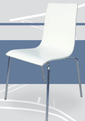
Art. 613 - cromo Art. 1313 - negro