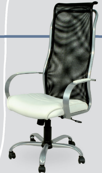
Art. 611 - cromo Art. 1311 - negro