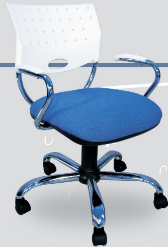
Art. 513 - cromo Art. 1213 - negro