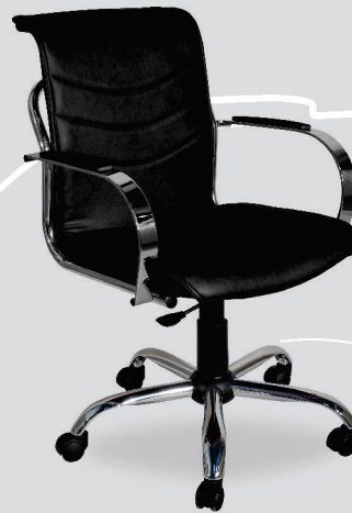
Art. 612 - cromo Art. 1312 - negro