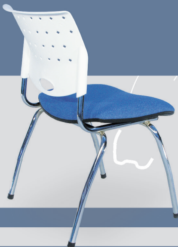
Art. 509 - cromo Art. 1209 - negro