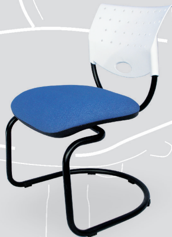
Art. 510 - cromo Art. 1210 - negro