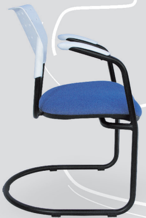
Art. 511 - cromo Art. 1211 - negro