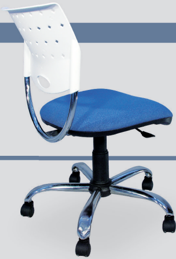
Art. 512 - cromo Art. 1212 - negro