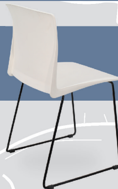
Art. 614 - cromo Art. 1314 - negro